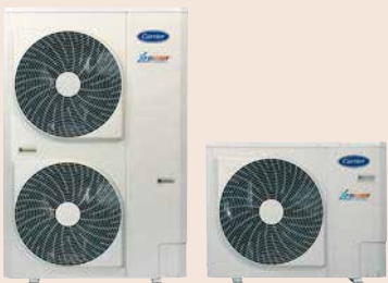
38AW dış üniteler