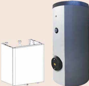
İkiz bölge seti