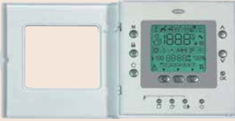
Comfort™ Serisi programlanabilir termostat