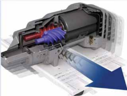
Carrier-Carlyle tasarımı geliştirilmiş 06T vidalı kompresörü