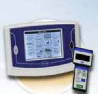
PRODIALOG PLUS- "Touch Pilot"