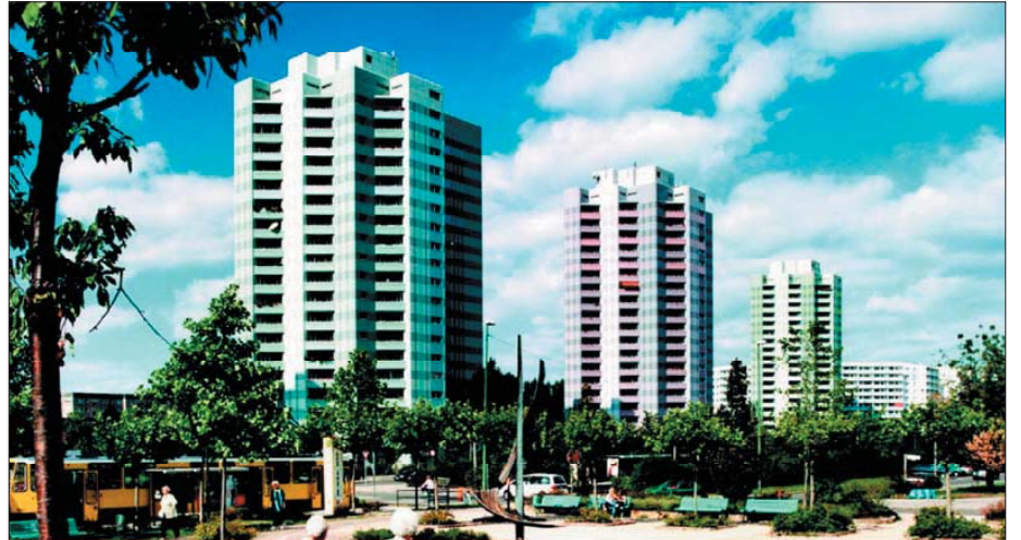
HOWOGE Immobilienmanagement GmbH, Berlin

"Techem ile yaptığımız sözleşme bize bariz bir tasarruf sağlıyor; ilk yatırımda, ısıtma maliyetlerinde ve yönetim masraflarında."