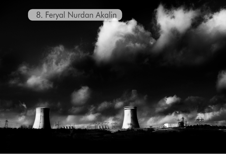
8. Feryal Nurdan Akalin