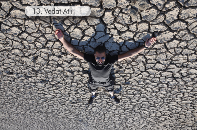
13. Vedat Atlı