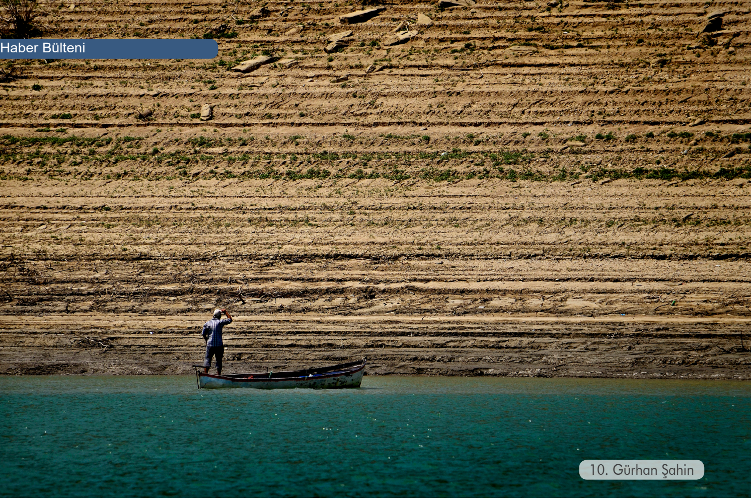
10. Gürhan Şahin