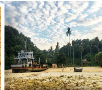
3. Furkan Bilal ORMAN