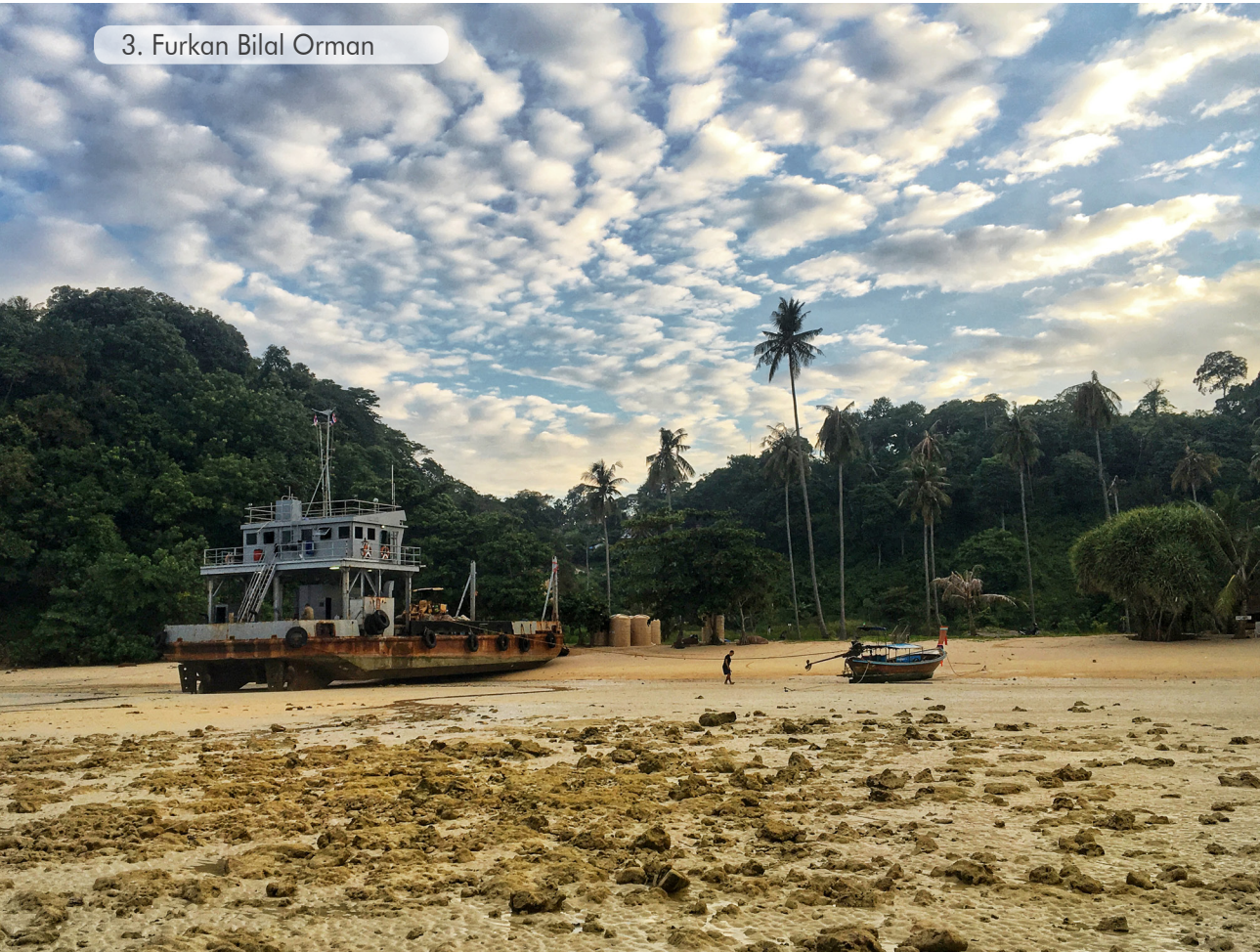
3. Furkan Bilal Orman