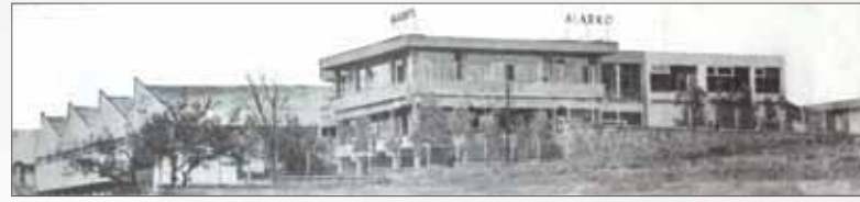
1970'lerin başında Rami Fabrikası

Mühendislik hizmeti olarak merkezi ısıtma, soğutma-klima ve havalandırma, elektrik, akaryakıt ve yakma kimyasal proses tesislerinin projelendirilmesi, gerekli özel imalatların yapılması ve kurulması, anahtar teslim komple tesis kurulması.