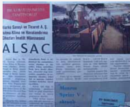
Alarko Holding'in yayın organı Bizim Dünya-mız dergisinde ALSAC'ın tanıtım haberi (1978)

oluşturan ısıtma, soğutma-klima ve havalandırma üretimini yürüten ALSAC'ın aynı süreçteki gelişimini inceleyeceğiz.