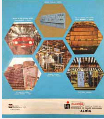
1974 sonrası kurulan ALMİM (Mühendislik ve İmalat Müessesesi) tanıtım broşürü

Bu gelişmeden sonra ALPOM'un 1980'li yıllara kadar uzanan ve pompa fabrikasının kurulmasıyla sonuçlanan gelişimini geçen sayımızda anlatmıştık. Bundan sonra Alarko Sanayi Ticaret'in (AST) ana faaliyet alanını