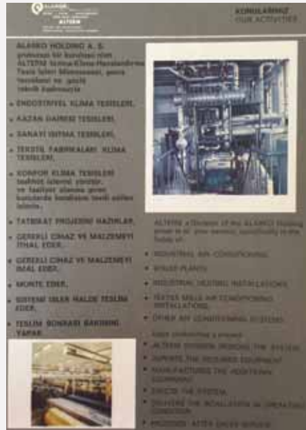
1974 sonrası kurulan ALTERM (Isıtma Klima Havalandırma Tesis Müessesesi) tanıtım broşüründen firmanın faaliyet alanları