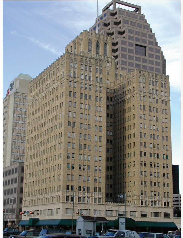
Tarihi Milam Binası, Teksas San Diego (1928), Carrier HK sistemi ile donatılmıştı

Carrier Weathermaker Evleri” etkinliğinin “Ev Konforu” kavramının yayılmasında ve HK sistemlerinin tanınmasında çok önemli dönüm