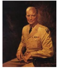
Chicago Uluslararası Kongre Salonu (sol), ABD Başkanı General Eisenhower (üst)

Bugün Chicago'da düzenli olarak her tür toplantı yapılıyor. Her yıl düzenlenen Chicago Otomobil Şovu'na bir milyonun üzerinde ziyaretçi geliyor.