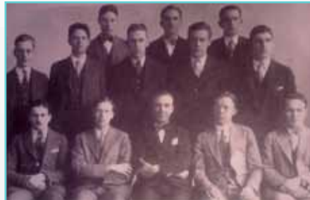
Carrier İş Enstitüsünde eğitim gören mühendisler (1940'lar)

Ancak ABD'de 1930'lu yıllarda başlayan "büyük buhran" ve ekonomik kriz hava koşullandırma endüstrisini de etkiledi. ABD buhrandan çıkmaya başladığı koşullarda, yeni bir iş umudu Carrier Koleji'ne ilgiyi arttırdı; Mart 1936-Kasım 1938 arasında 400 mühendis eğitildi. Bu durum hava koşullandırma endüstrisinde toparlanmanın motorlarından biri olarak değerlendirildi. Bu kadar çok katılımlı ve uzun süreli eğitim ABD'de endüstriyel eğitim bakımından ilk örnekti.