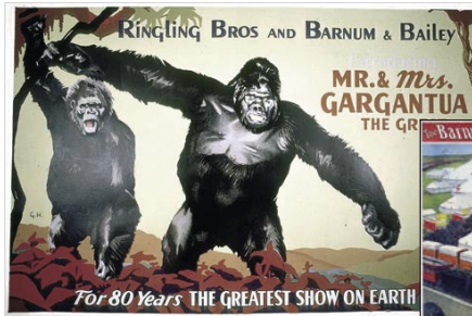
Eski Barnum ve Gargantua afişleri

1941'de yayımlanan bir reklamda, Gargantua'nın Mitoto adlı bir dişi gorille evleneceği ve bir "düğün töreni" yapılacağı duyuruluyordu. Kısaca "Toto" denilen ve "Mrs. Gargantua" olarak bilinen dişi goril için de Gargantua'nın kafesi yapıldı. Tur sırasında sirk elemanları Gargantua'yla Mrs. Gargantua'nın kafeslerini birbirlerinin karşısına koyuyor ve böylece birbirlerine alışmalarını sağlıyordu.