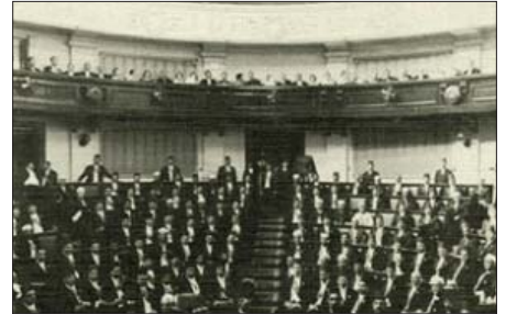
Carrier tarafından soğutulan Mısır Parlamento Binası, oturum sırasında

ma sözleşmesini de üstlendi. 1999'da tamamlanan kütüphanede binlerce antik kitabın yanı sıra modern edebiyat ürünleri ve multimedya belgeler de bulunuyor.