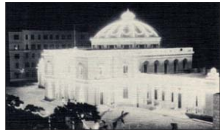
Mısır Parlamentosu, 29 Temmuz 1937'de Kral Faruk'un tahta çıkış töreninde Carrier tarafından soğutuldu