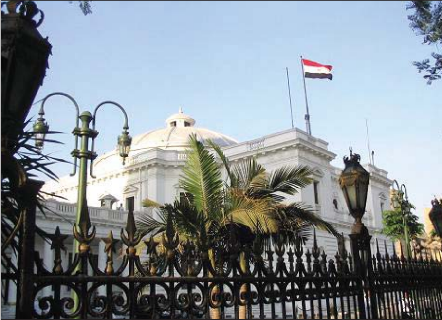
Mısır Parlamento Binası

Modern klimalar Mısır'a ancak 1937'de ulaştı. 29 Temmuz 1937'de Kral Faruk'un tahta çıkış töreninde Mısır Parlamentosu Carrier tarafından soğutuldu. Bu bina daha sonra Halk Meclisi Binası olarak adlandırıldı.