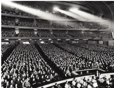
1933 yıllarında Radio City Konser Salonu

Radio City, sinema yapımcılarının ve izleyicilerinin en sevdiği salonlardan biri oldu. Açılıştan iki hafta sonra Radio City Konser Salonu'nda The Bitter Tea of General Yen (General Yen'in Acı Çayı) adlı film gösterildi. Çok geçmeden, bir filmin ilk kez burada gösterilmesi, ülke çapındaki başarısını artıran bir etken oldu. Büyük ekranı ve geniş aralıklı koltuklarıyla ideal bir sinema salonuydu. 1933'ten bu yana 700'ün üzerinde film ilk kez burada gösterildi. King Kong, Elizabeth Taylor'ı ünlü yapan National Velvet (Büyük Yarış), White Christmas (Karlı Noel); Mame, Breakfast at