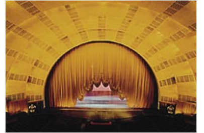
1999'da 70 milyon dolarlık yatırımla yenilenen Radio City

Büyük Sahne, Radio City'nin bir başka önemli salonu. 18 m yüksekliğinde ve 30 m genişliğindeki yüksek kemerli sahne önüyle dünyanın en iyi donanımlı sahnesi olarak kabul ediliyor. Hidrolik enerjisiyle çalışan asansörler üzerine yerleştirilmiş üç bölümden oluşuyor. Sahne yapıldığında