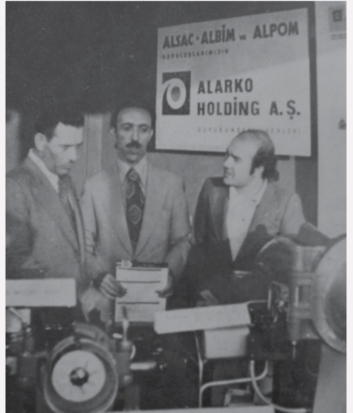
1975 Kocaeli Sanayi Fuarı'nda Alarko Sanayi ve Ticaret AŞ standı. Dönemin Sanayi ve Ticaret Bakanı'nı ziyareti.