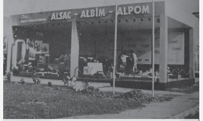
Alarko Sanayi ve Ticaret AŞ'nin katıldığı, 1975 yılındaki Kocaeli Fuarı'ndaki standı.

Gelecek bölümlerde ALSAC, ALBİM ve ALPOM üzerinden AST'nin imalat sanayi alanındaki gelişmesini inceleyeceğiz.