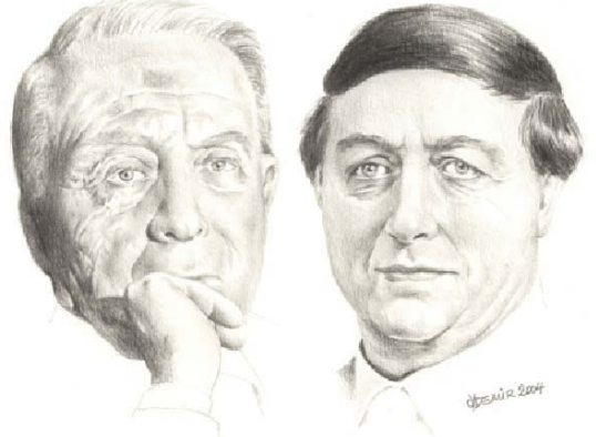
50 Yıllık Başarılı Bir Geçmişin Mimarları

Alarko'nun İshak Alaton ve Üzeyir Garih tarafından 1954 yılında kurulmasından bu yana yarım yüzyıl geride kaldı. Bu 50 yıl, iki genç girişimcinin "sıfırdan" başlayıp bugün sanayiden ticarete, turizmden inşaat, enerjiden gıdaya bir çok alanda, yurt içinde ve dışında faaliyet gösteren, ürünleri dünyanın çeşitli ülkelerinde satılan, yine kurduğu tesisleri ile dünyanın değişik yörelerinde hizmet veren büyük bir kurum yaratmalarının öyküsü olduğu kadar, Türkiye'de özel sektörün sanayi, ticaret ve hizmet gibi alanlarda oluşum ve gelişim tarihinin de tipik bir sayfasıdır. Nitekim Alarko'nun 50 yıllık tarihi bir çok ilklerle doludur.