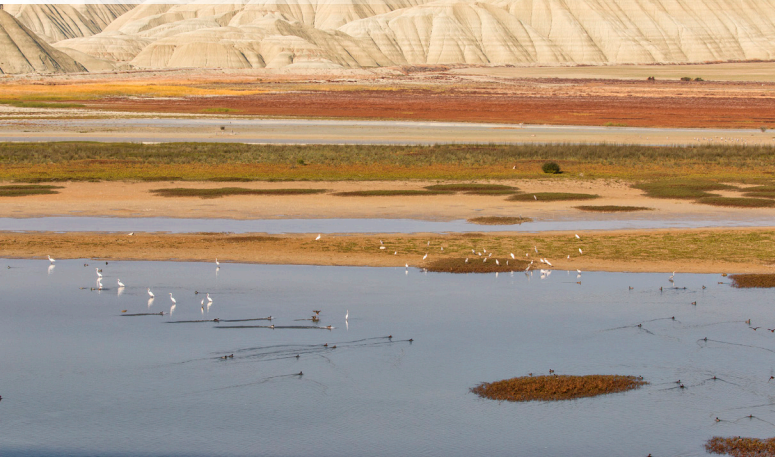
4. Hasan Güzel