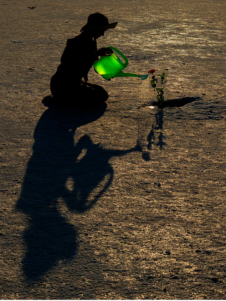
2. Dilek Uyar