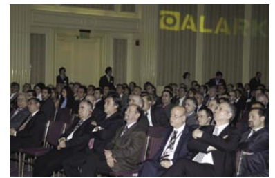
Plaket töreninden (en üstte), Toplantıya katılanlar (üstte), Carrier Holland Heating'den Bakkaren sunum yaparken (altta)