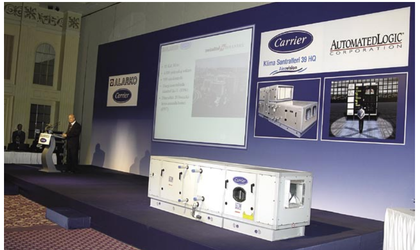
İsmet Gencer sunum yaparken